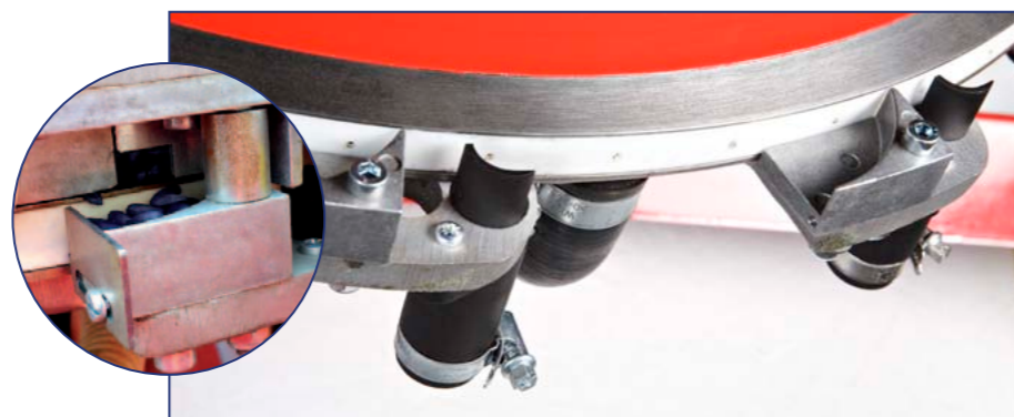
Sélecteur de petites graines

Cette technologie place la distribution centralisée Herriau Turbosem au plus haut niveau de la précision sur le marché.